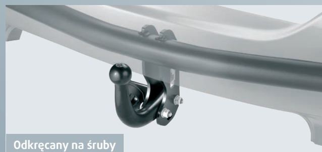
Odkręcany na śruby